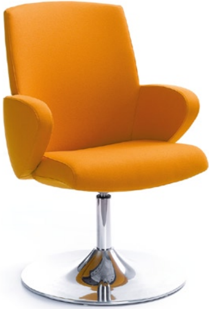
FORMAT 20R CHROM