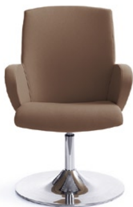
FORMAT 20R CHROM