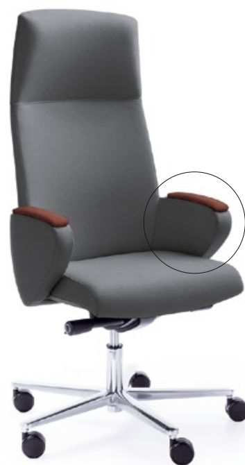
FORMAT 10SL CHROM H

* nakładka tapicerowana na podłokietnik: modele tapicerowane Skórą, Softline, Eco - nakładka w kolorze tapicerki fotela, modele tapicerowane tkaniną - zawsze czarny Softline * upholstered arm pad: models with leather, Softline or Eco upholstery - arm pad upholstered with the same colour, models with fabric upholstery- black Softline on the pad