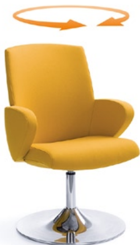
FORMAT 20R CHROM

w wersji na okrągłej podstawie amortyzator standardowo posiada funkcję pamięci powrotu, która umożliwia powrót do pozycji wyjściowej ustawienia fotela in version with round base the gas lift is additionally equipped with memory thanks to which the armchair returns to its previous position