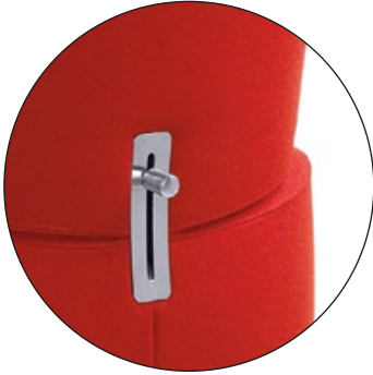
ODCINEK ŁĘDŹWIOWY LUMBAR SUPPORT

regulacja podparcia odcinka lędźwiowego lumbar support adjustment