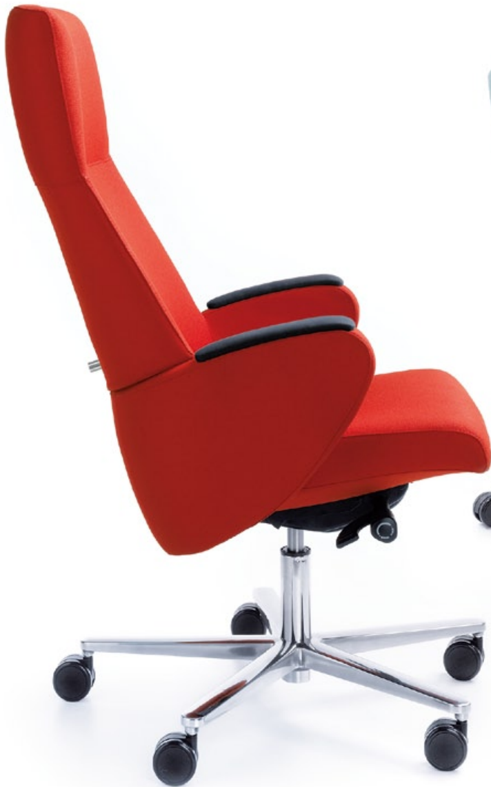
FORMAT 10SL CHROM O