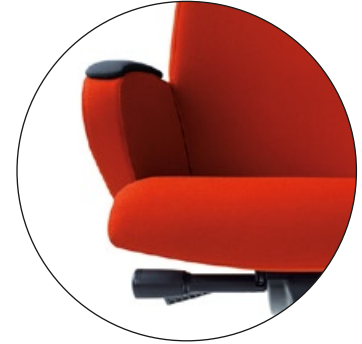
DOPASOWANIE DO WZROSTU I WAGI CIAŁA HEIGHT AND TILT FORCE ADJUSTMENT

regulacja wysuwu siedziska sliding seat adjustment