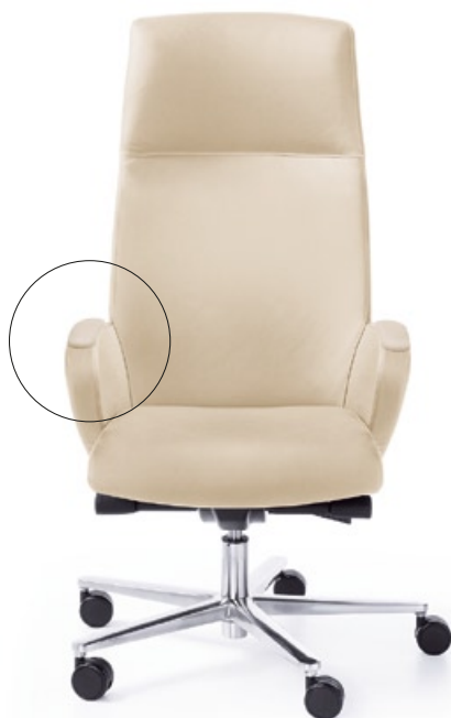
FORMAT 10SL CHROM O