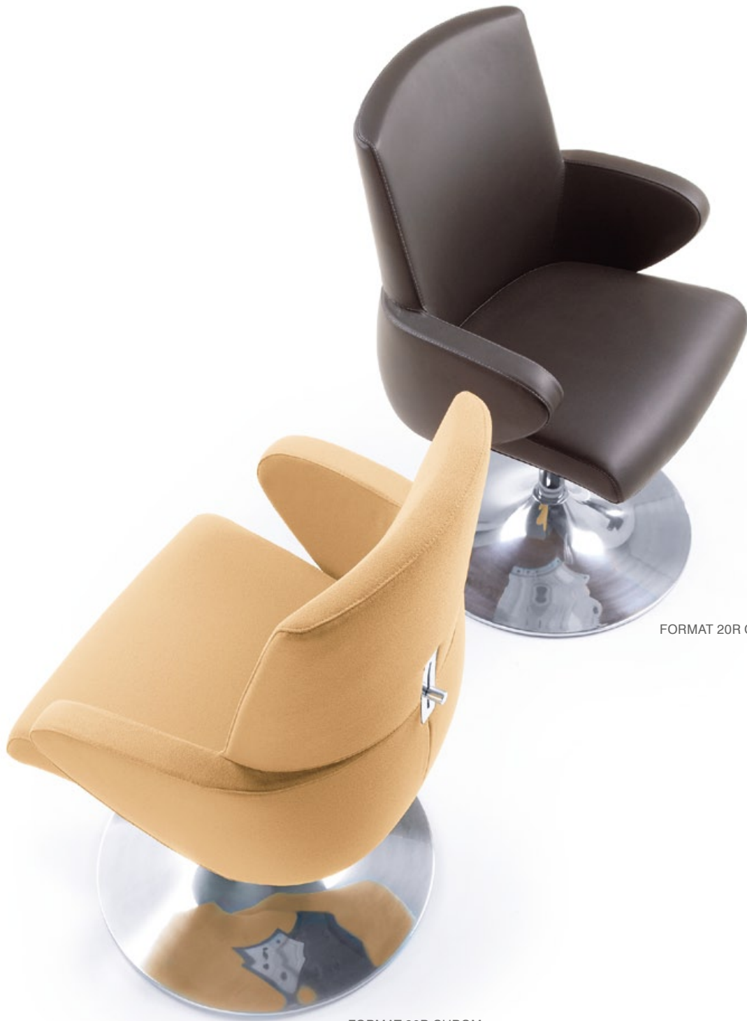
FORMAT 20R CHROM