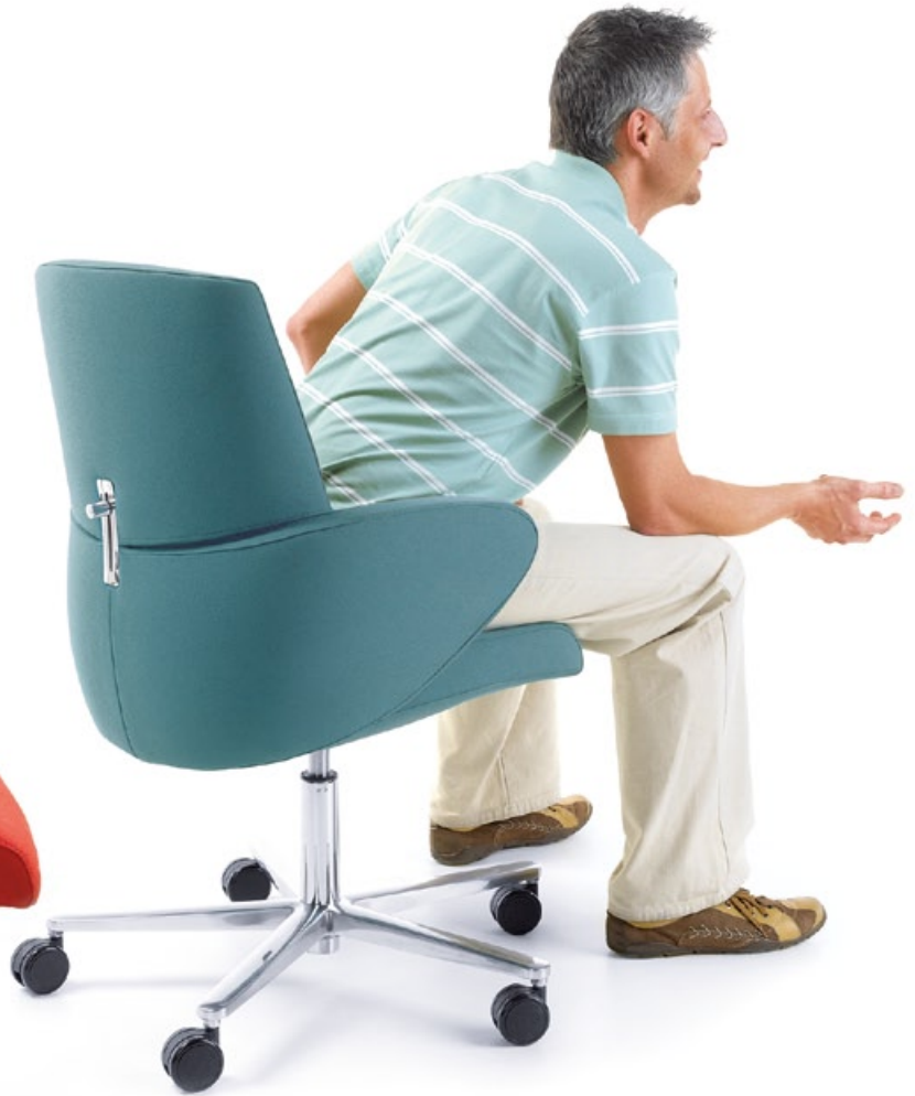
FORMAT 20E CHROM