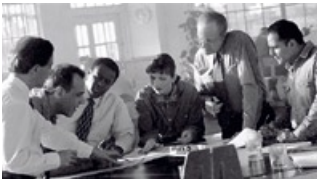
Design: R&S Activa