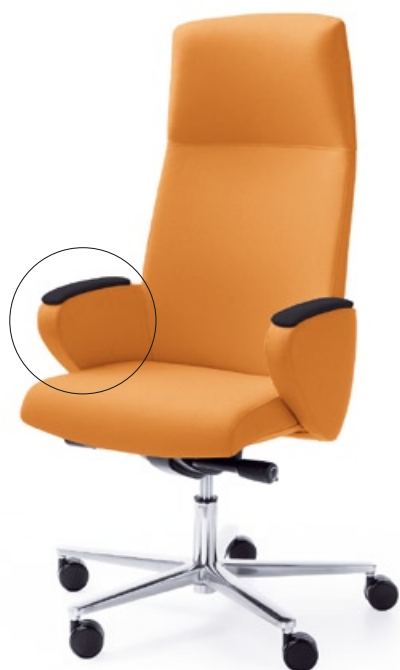
FORMAT 10SL CHROM O

Dostępne 2 rodzaje nakładek na podłokietniki: tapicerowane* lub drewniane 2 kinds of arm pads are available: upholstered* or wooden arm pad