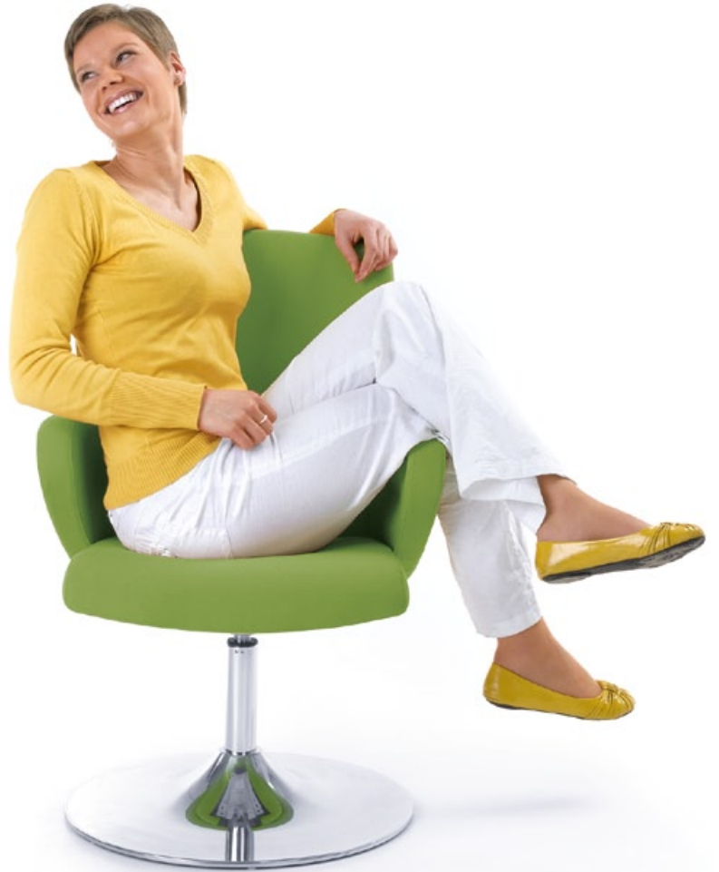
FORMAT 20R CHROM