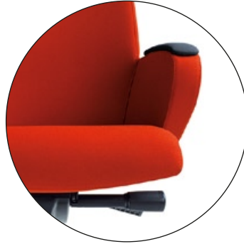
MECHANIZM SL MECHANISM SL

regulacja podparcia odcinka lędźwiowego lumbar support adjustment