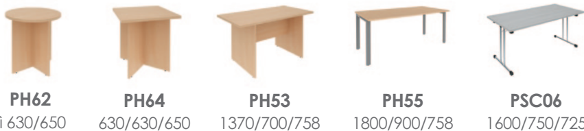
PH62 fi 630/650 PH64 630/630/650 PH53 1370/700/758 PH55 1800/900/758 PSC06 1600/750/725