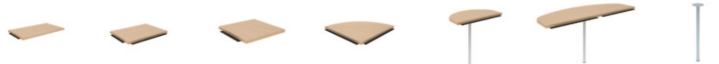
TH11 500/900 TH09 500/700 TH10 500/500 PH77 700/700 PH70 400/700/758 PH75 500/1400/758 NH41 fi 40/730