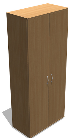
YSO55 800x420x1880 mm Szafa garderobiana