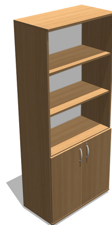
YSO56 800x420x1880 mm Szafa - regał