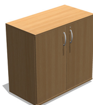
YSO27 800x420x770 mm Szafa aktowa