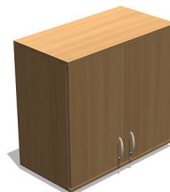
YSO20 800x420x740 mm Nadstawka