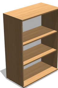
YSO38 800x420x1140 mm Regał aktywny