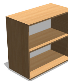
YSO28 800x420x770 mm Regał aktywny