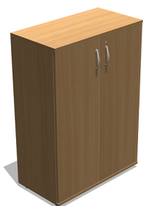
YSO37 800x420x1140 mm Szafa aktowa