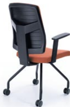
RAYA 21H CZARNY P46PU KÓLKA