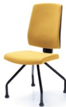
RAYA 23H CZARNY STOPKI