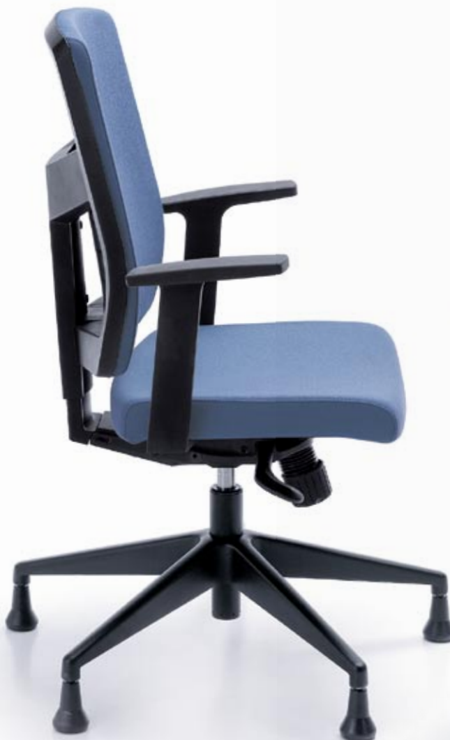
RAYA 21S CZARNY P46PU