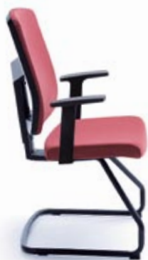
RAYA 21V CZARNY P46PU