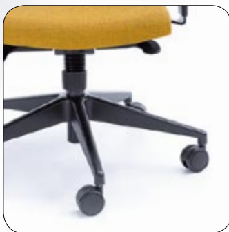
Baza standard Standard base