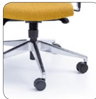
+Baza chrom +Base chrome