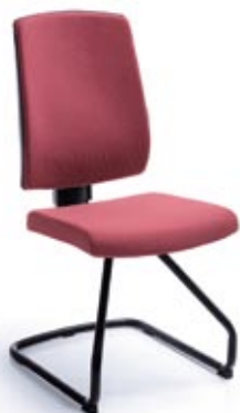
RAYA 21V CZARNY