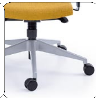
+Baza metalik +Base metallic