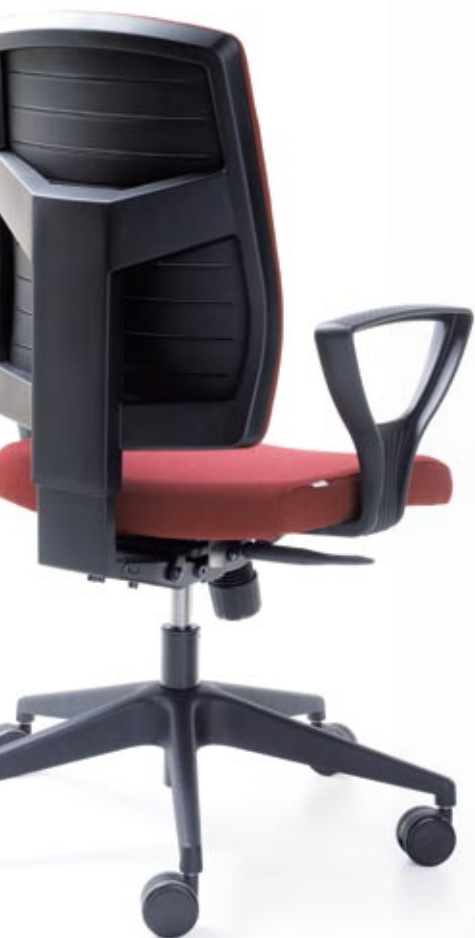
RAYA 21S CZARNY P52PA